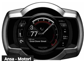
Ansa - Motori Triumph, arriva il nuovo My Triumph Connectivity System

Articoli correlati Di più dello stesso autore