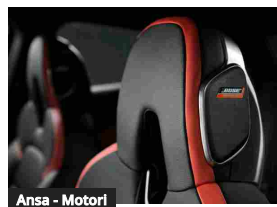
Ansa - Motori Nissan Juke, dal Bose al Connect: connettività top a bordo