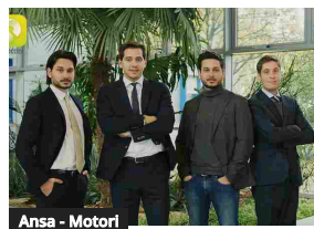
Ansa - Motori Spotter, la app per sharing parcheggi che fa guadagnare