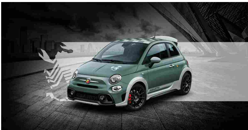
NUOVA 695 70° ANNIVERSARIO

Inoltre, rispettano la sicurezza e la tutela dell'ambiente perché sottoposti a continui controlli per verificarne la resistenza: quindi rappresentano una scelta affidabile per l'automobilista. Un'alternativa può essere quella di acquistare dai produttori di primo impianto (delle aziende meccaniche specializzate) con cui le case automobilistiche collaborano per fare in modo che vengano progettati e fabbricati gli stessi identici pezzi che sono stati installati sull'auto nuova.