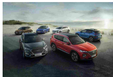
Hyundai Promise: l'usato garantito guarda al futuro con una promessa di qualità