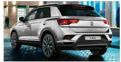
T-Roc. Born Confident.