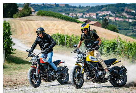
Ducati Service Warm Up