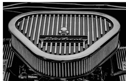
Ricambi auto, aumentano gli acquisti online

I ricambi delle auto originali sono identici a quelli che sono stati installati durante la fabbricazione