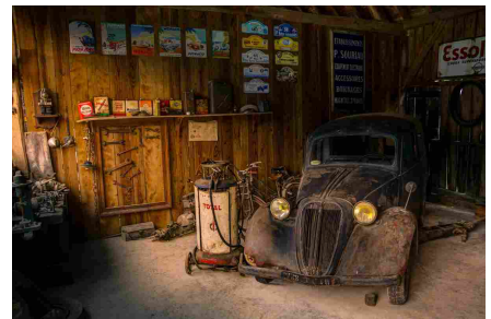
Ricambi auto, conviene o no acquistare online?

L'automobilista può scegliere, per riparare la sua auto, di ricorrere a pezzi di ricambio originali, usati o rigenerati.