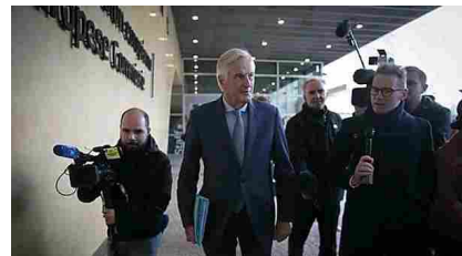
Borse Europee accelerano con l'accordo sulla Brexit, vola la sterlina - Economia