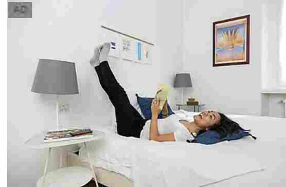
Casavo | Il 1° Instant Buyer Immobiliare | Richiedi un'offerta gratuita CASAVO