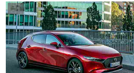
Nuova Mazda3, con il nuovo motore ibrido Skyactiv-X da 180 CV. Scoprila. Mazda.it