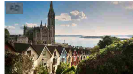
Ecco i 5 villaggi più belli nell'Ireland's Ancient East. Ireland.com