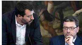
Bankitalia: Salvini, riforma va fatta - Economia