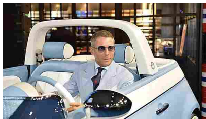
Fca, stop 500 elettrica in Nord America - Economia