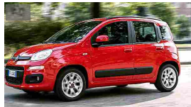
Usate, nuove, e a Km 0: risparmia con il GPL Annunci auto GPL