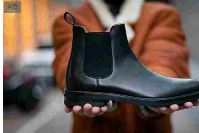
Velasca: Il loro modello di business è geniale. Clicca qui. Velasca