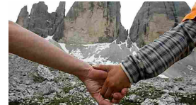
Alpinisti salvati su 3 Cime: non paghiamo