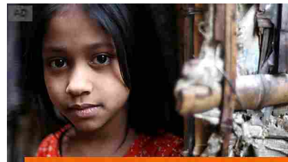
Ti sembra contenta di essersi appena sposata? Terredeshommes.it