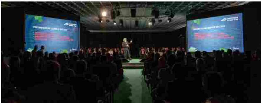
Un momento della prima edizione di Service Day

Service Day 2019: tutto è pronto. Manca meno di un mese all'evento organizzato da Quintegia e AsConAuto , e focalizzato sul post vendita . L'appuntamento è fissato per venerdì 8 e sabato 9 novembre 2019 al Brixia Forum di Brescia .